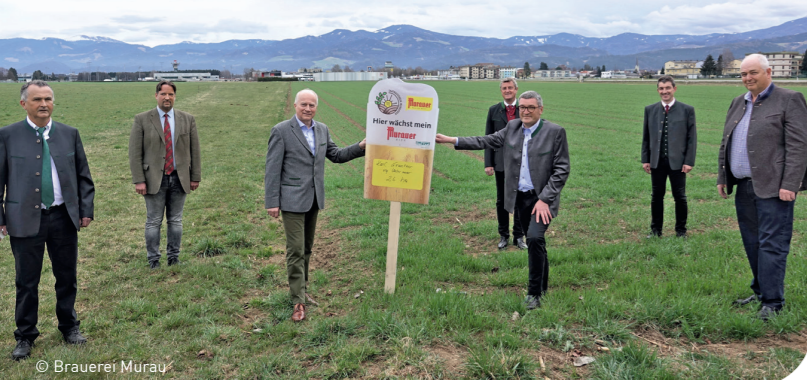
Vorstellung des Projekts „Brauerste aus regionaler Landwirtschaft“.